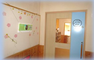
1歳児クラスの入り口です