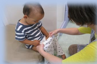
オムツ交換の様子です