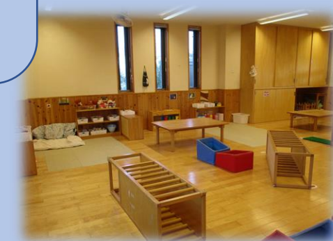
自分の体の使い方を学んでいける様な 空間作りを考えています